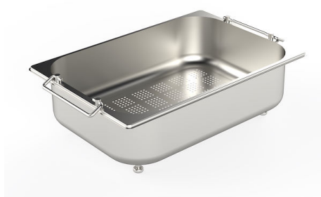
escurrir pasta en acero inoxidable 8154 000