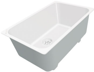
Cubeta blanca 8153 100