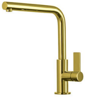
Monomando Omega Gold