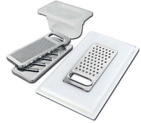
Kit rallador con soporte para anillo y bandeja de recogida de alimentos